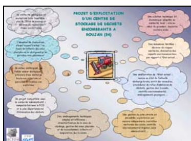
Document de présentation lors de l'enquête publique